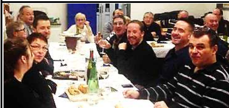
Soirée découverte de vins d'Alsace le 10 mars 2017 - 23 participants