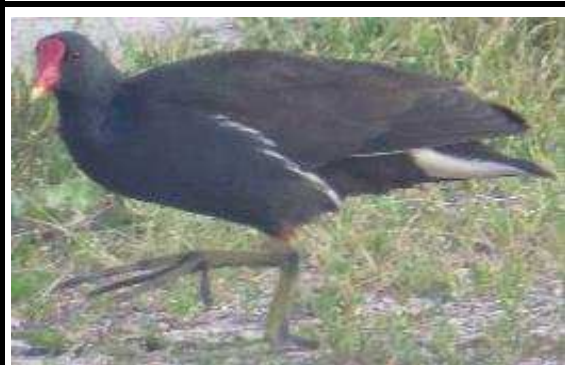
La Gallinule Poule d'eau

Vacances scolaires été du samedi 8 juillet 2017 au lundi 4 septembre 2017 matin